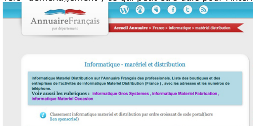
fig 1 : haut de page