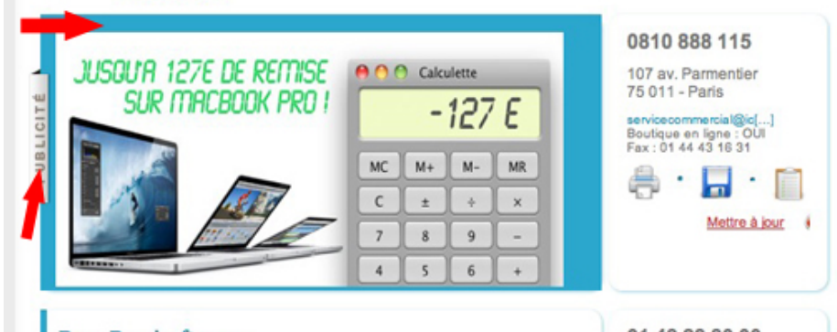
fig. 6 : panneau repliable 400x200 par clic – libre de conception

// zone repliable "publicité" (fig : 6), de 400x200, l'entreprise peut mettre le code qu'elle veut ( libre ), image etc., c'est de l'ajax qui charge un fichier externe. L'entreprise a toutes les libertés (sous vérification quand même), afficher une vidéo , image, flash , vignette d'autres sites et liens (en dur).