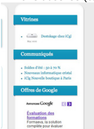
fig. 7 : vitrine, actualité/communiqués et annonces google texte.